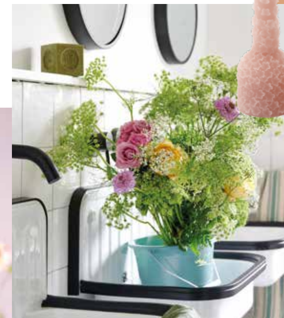
Blumensträuße sehen poetisch aus

Es werden bekannte nostalgische Materialien wie Keramik, Porzellan, traditionelles Flechtwerk, Emaille, Korb, Zink und Gusseisen verwendet. Auch auf natürliche Textilien, Holz, Kork und Leder wird Wert gelegt.