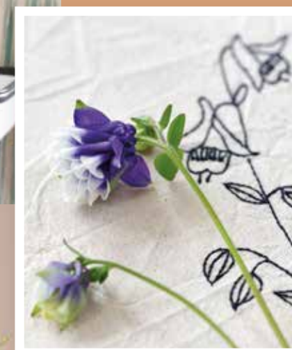
So als habe jede einzelne Blume eine bestimmte Bedeutung.