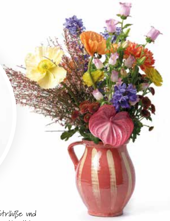
Farbenfrohe Sträuße und Arrangements mit wilder Ausstrahlung