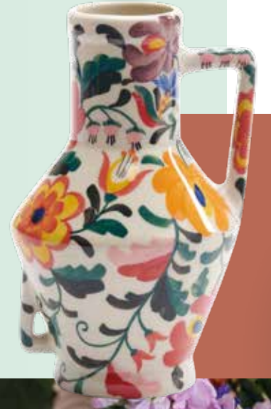
Wichtigste Inspirationsquelle für Muster sind die 70er-Jahre oder Folklore