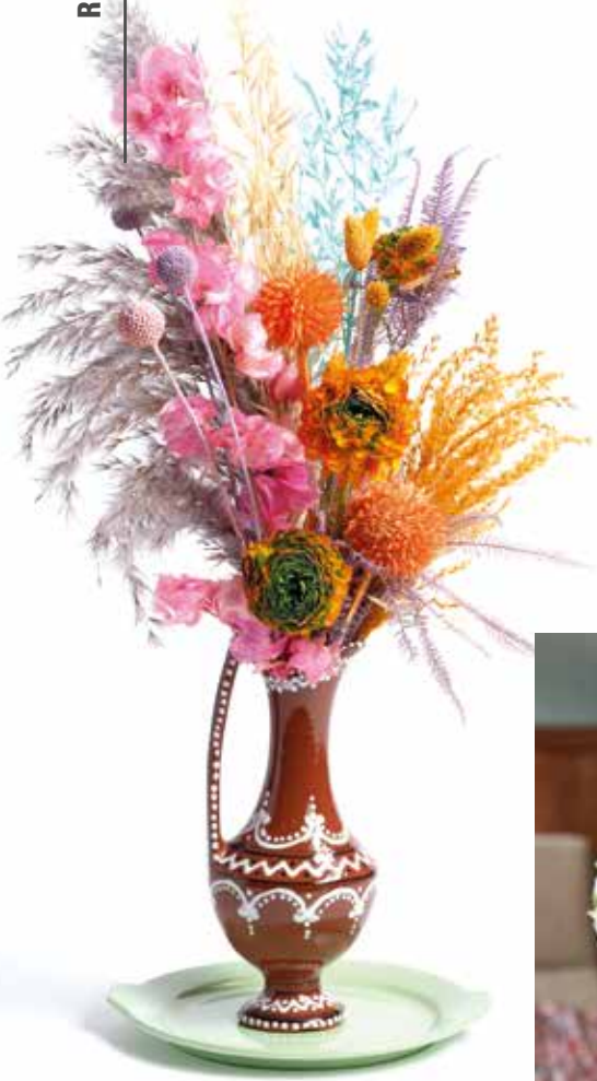
Trockenblumen werden nach wie vor verwendet, stehen aber keinesfalls im Vordergrund

Pflanzen tragen eindeutig zum Gefühl einer warmen Heimeligkeit bei. Sie sind allgegenwärtig und scheinen ein fester Bestandteil des Lebens zu sein – eine Pflanze passt überall hin. Gleich daneben werden Außenseiter willkommen geheißen und besondere Formen gehegt und gepflegt.